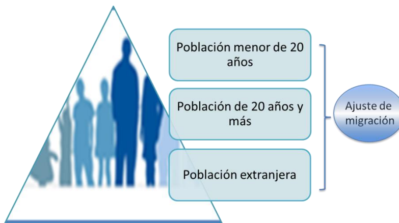
Figura 1 Población base de las estimaciones y proyecciones subnacionales de población

Tal como se muestra en la figura 2, una vez establecida la población base se estima el comportamiento de la mortalidad, fecundidad y migración y por ende el tamaño y estructura de la población. Para mayor detalle consulte el documento “Documento metodológico estimaciones y proyecciones de población distritales, disponible en www.inec.go.cr .